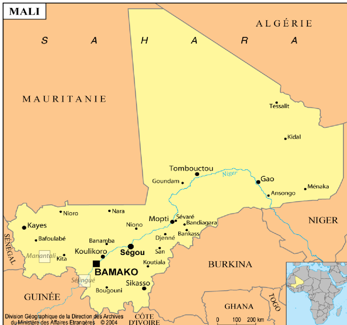
Carte générale du Mali et localisation des deux lacs de barrage étudiés en 2002-2003 : Manantali et Sélingué.