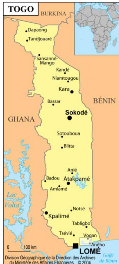
Figure 1 : Carte générale du Togo et localisation du lac Togo (encadré).